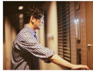
▲ 専有部も“顔ダケで”