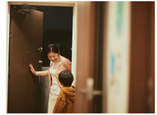
▲ 友人なども“顔ダケで” ※アプリで招待