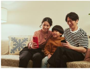
▲ アプリから1度だけ顔登録