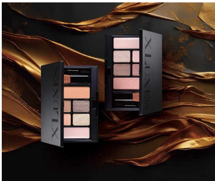
「エクスリュークス デザイニング メイクパレット」 01 ベージュ(左)、02 ピンク(右)

株式会社 ストリーム（東京都港区、代表取締役社長：齊藤 勝久）の子会社である化粧品・健康商品の開発・製造・販売を行う株式会社 エックスワン(東京都港区：代表取締役 会長兼社長 齊藤 勝久)は、先進の技術を応用したヒト幹細胞培養液 *1 配合の「XLUXES(エクスリュークス)」シリーズから、アイカラーベースを含むメイクパレット「エクスリュークス デザイニング メイクパレット (ベージュ/ピンク)」(各 税込 13,986 円)を11月11日より直営店舗及び当社直販サイトや他ECサイト等で販売します。