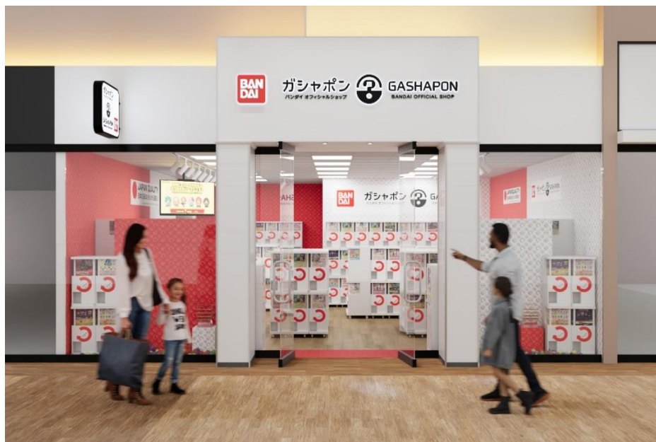
『GASHAPON BANDAI Official Shop US Grapevine Mills』外観