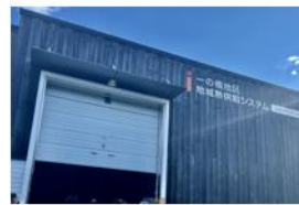
地場の森林バイオマスを活用し、地域熱供給システムを稼働