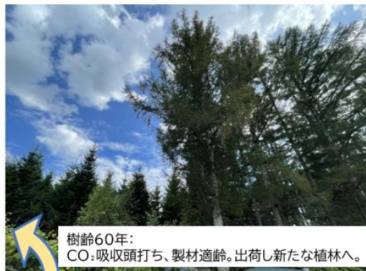
樹齢60年： CO 2 吸収頭打ち、製材適齢。出荷し新たな植林へ。