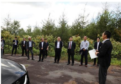
町有林において循環型森林経営の様子を視察

寄附金贈呈式は下川町桜ヶ丘公園内にある「ガーデニング・フォレスト フレペ」にて開催。また、贈呈式後には下川町有林を視察し、寄付金を活用した取り組みである循環型森林経営が実践されている様子を視察いたしました。