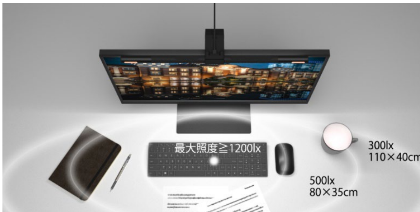
机上面の明るさ目安