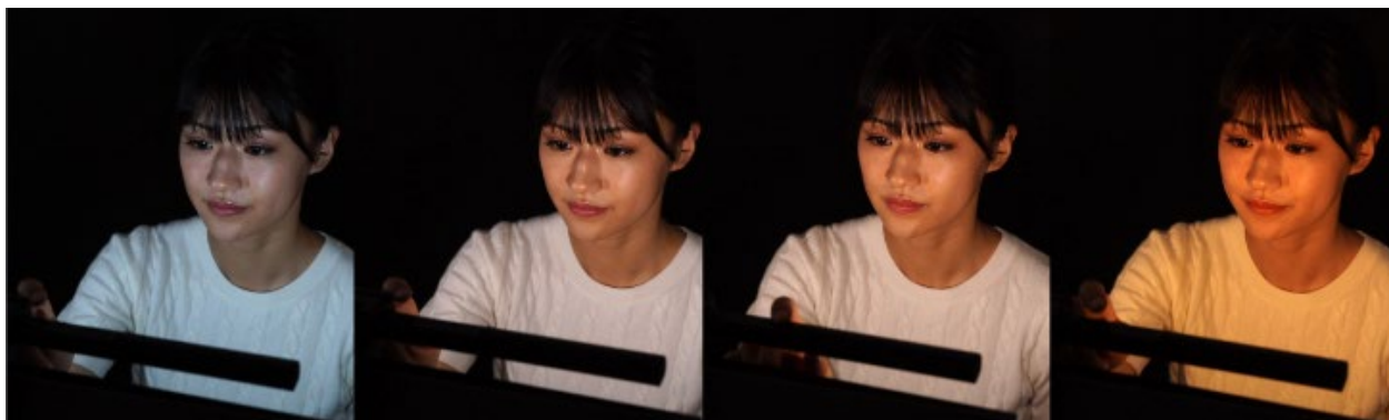
フェイスライトの調色効果