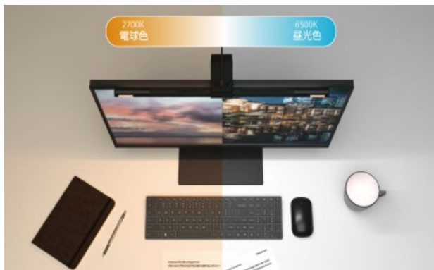
主照明の調色イメージ

主照明とフェイスライトは、連続・多段階で調色・調光が可能です。それぞれを単独で制御できますので、主照明は昼光色、フェイスライトは電球色にするなど、使用シーンに合わせた組み合わせが設定できます。ボタン長押しの場合は連続操作、ボタン短押しの場合は多段階操作、フラストレーションなく、簡単にお好みの光に調整できます。ライトバー前面に調色・調光のインジケーターを配置することで、明るさや光色の状態を一目で確認できます。