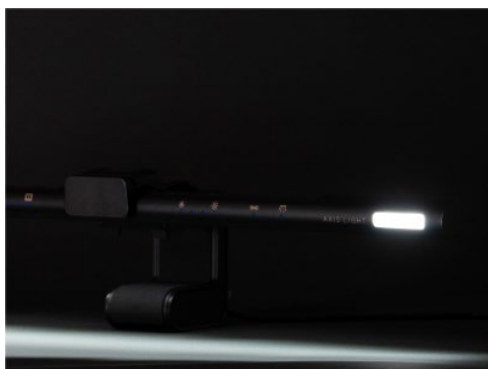
フェイスライト点灯 (右側)

フェイスライトの点灯により顔を綺麗に照らすことができ、モニターに映る自分の暗い顔に“さよなら”できます。