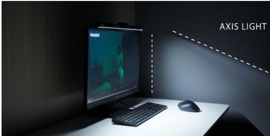
非対称設計の照射効果