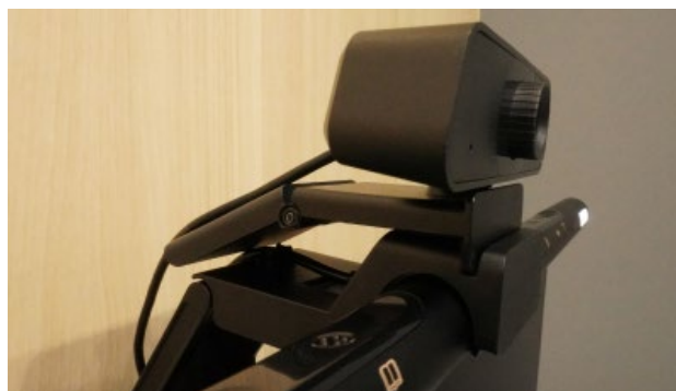
WEBカメラ設置(横)スリットへの装着図