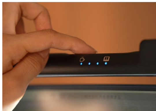
操作中のインジケーター