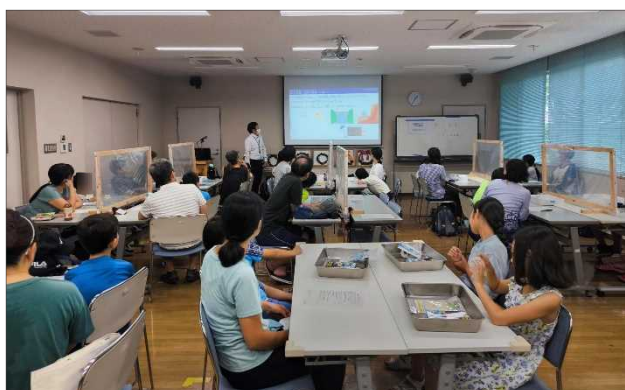
環境学習会の様子