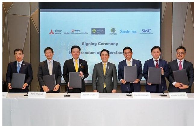
(MOU サイニングセレモニー)

本イベントで、MRI は、アユタヤ銀行、Krungsri Finnovate Company Limited(アユタヤ銀行のCVC)、チュラロンコン大学サシン経営大学院付属のコンサルティング部門である Sasin Management Consulting、同日本ユニット SASIN Japan Center、MU Research and Consulting (Thailand) Co., Ltd(三菱 UFJ リサーチ&コンサルティング株式会社の連結子会社)と、日・ASEAN のイノベーション・エコシステムの促進およびこれに資するセミナーやワークショップ等の協働活動を目的とする MOU を締結しました。連携ネットワークの強化と相互の知見の増強により、日・ASEAN スタートアップの活動の促進とこれを支える好循環の仕組みを構築し、社会課題解決につなげることを狙っています。