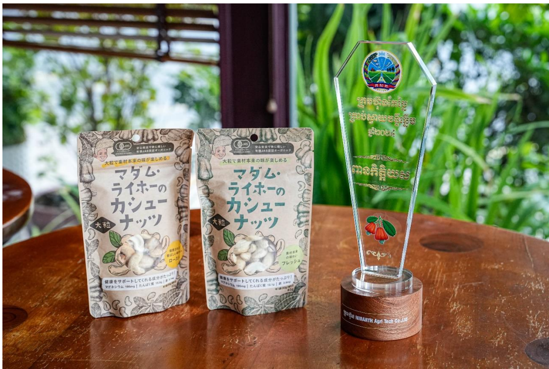
マダム・ライホーのカシューナッツ ( https://madam-laihout.jp/ )

この度、カンボジア農林水産省農業産業局主催の「Cashew Nuts Outstanding Processors Competition in 2024」にエントリーし、最終ラウンドが6月6日にプノンペンで開催され『名誉賞』を受賞いたしましたのでお知らせします。