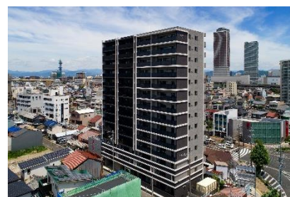
モアグレース岐阜加納スクエア