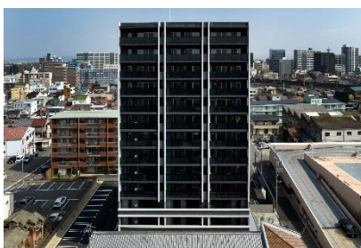
モアグレース一宮新生