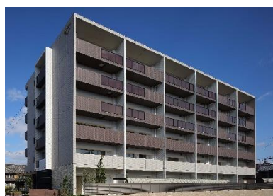
モアグレース各務原市民公園