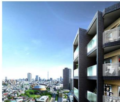
ルジェンテ新宿御苑前 (外観完成予想CG)