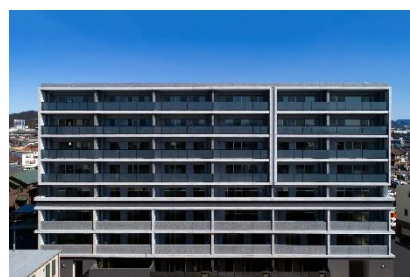
モアグレース加納駅前