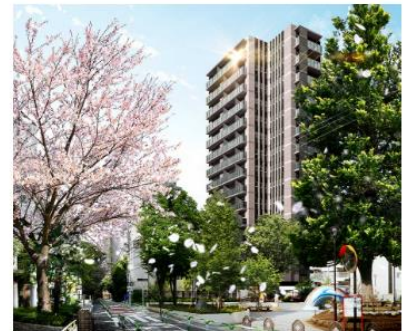
ルジェンテ文京湯島 (外観完成予想CG)