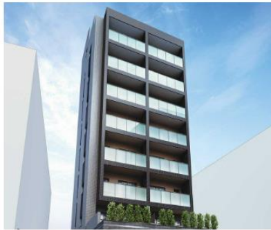
ルジェンテ池袋立教通り (外観完成予想CG)