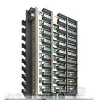
ルジェンテ新丸子 (外観完成予想CG)