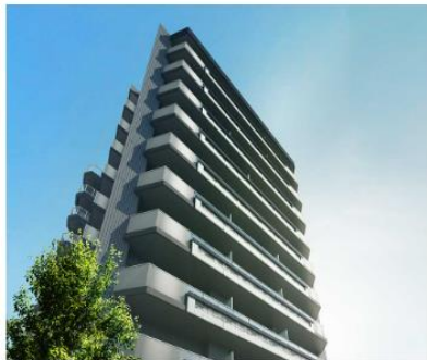
ルジェンテ日暮里ガーデン (外観完成予想CG)