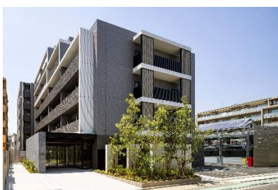
モアグレース徳川