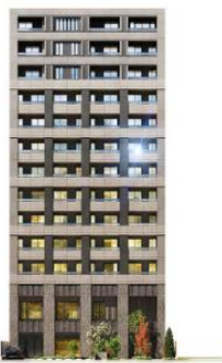
ルジェンテ上野黒門町 (外観完成予想CG)