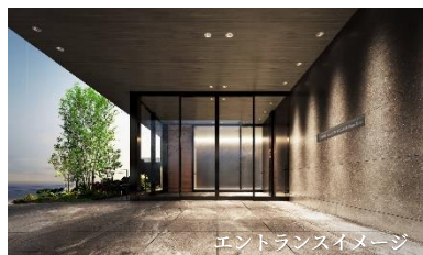
エントランスイメージ

ルームプランは 1LDK/42 m 2 台～3LDK/57 m 2 台（※防災倉庫面積を含む）とお客様の幅広いニーズに対応しております。