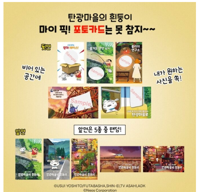
PopUp 스토아限定フォトカード