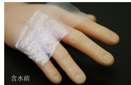
他家(同種)乾燥ヒト培養表皮

当社は、国内初となる他人の皮膚組織を原材料としたレディメイド(事前に製造・保存しておき、必要な時に遅滞なく使用することができる)製品である「Allo-JaCE03」を開発しています。本製品は培養表皮を乾燥させたものであり、生きた細胞を含まないため、「再生医療等製品」ではなく「医療機器」に分類されます。本製品を製造販売・製造するためには、新たに医療機器に関する業許可取得および登録が必要でした。当社は、患者さん自身の細胞を用いた自家再生医療等製品で培ったノウハウをもとに本製品の上市を目指します。他人の細胞を用いた製品に展開するとともに、本製品を含めた医療機器の開発・製造も視野に、さらなる事業拡大を進めます。