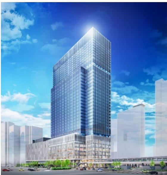
入居予定の「JPタワー大阪」外観