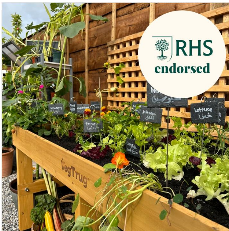
【推奨商品 VegTrug シリーズの商品】