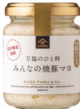
万福のひと時 みんなの焼豚マヨ 592円⇒480円（税込）