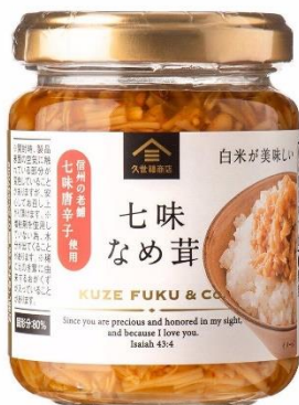
白米が美味しい 七味なめ茸 452円⇒390円（税込）