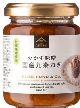
おかず味噌 国産九条ねぎ 592円⇒500円（税込）