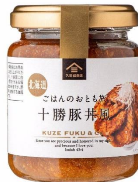
ごはんのおとも旅 十勝豚丼風 646円⇒550円（税込）