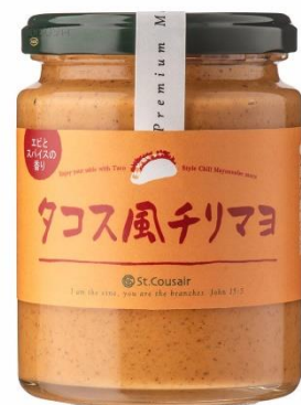
タコス風チリマヨ 711 円⇒598 円（税込）