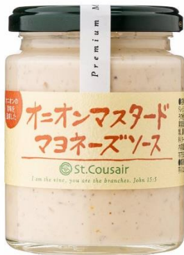
オニオンマスタード マヨネーズソース 646 円⇒498 円（税込）