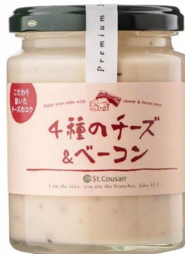
4 種のチーズ&ベーコン 842 円⇒760 円（税込）