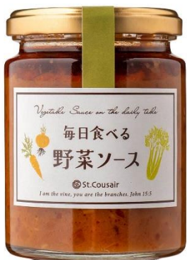
毎日食べる 野菜ソース 711 円⇒598 円（税込）