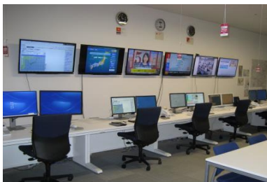
（写真左上）ADSCの代替機能を配備した関東支社CSC （写真右上）ADSC大阪 （写真左下）ADSC小牧