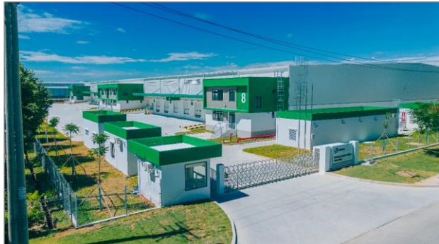
セムコープ ロジスティクスパーク (クアンガイ) 外観

今般、開発を進めてきたベトナム中部の VSIP クアンガイ工業団地と VSIP ゲアン工業団地内の物流倉庫「セムコープ ロジスティクスパーク (クアンガイ)」と「セムコープ ロジスティクスパーク (ゲアン)」（以下、「両物件」）が竣工しましたので、お知らせします。