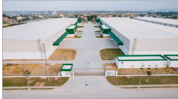
セムコープ ロジスティクスパーク (ゲアン) 外観

この竣工により、セムコープ インフラ サービス社を通じて運営する物流倉庫は、ベトナム北部の竣工済物件を合わせると、棟数は計 10 棟、総賃貸面積は約 13 万㎡（約 4 万坪）となっています。