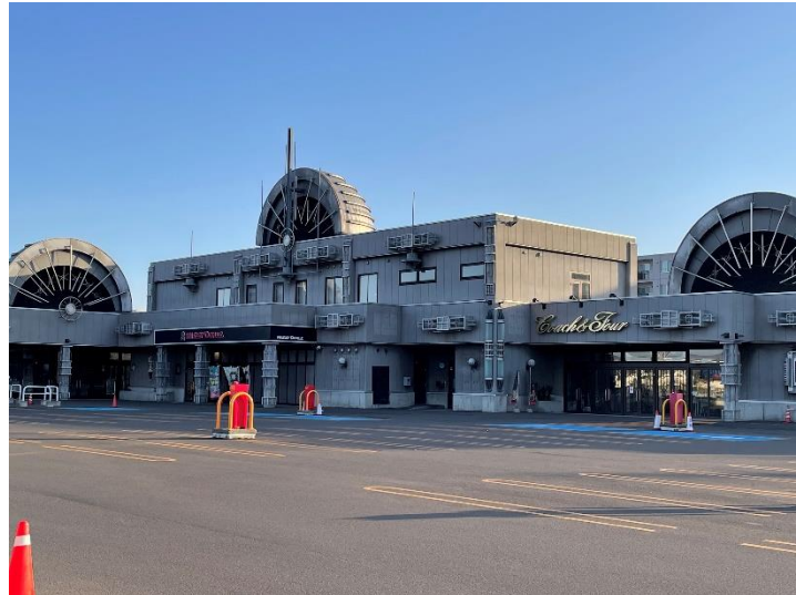
※『コーチャンフォーミュンヘン大橋店』外観

[施設名称] gashacoco コーチャンフォーミュンヘン大橋 [所在地] 北海道札幌市豊平区中の島 1 条 13 丁目 [営業時間] 9 : 00～21 : 00 年中無休