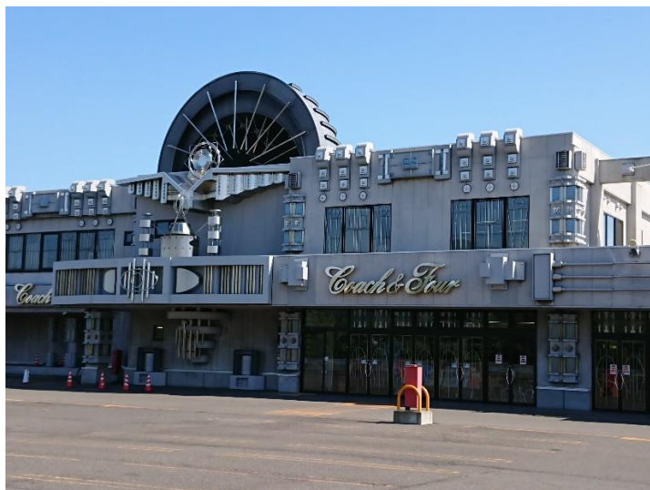
※『gashacoco コーチャンフォー新川通り』外観

[施設名称] gashacoco コーチャンフォー新川通り [所在地] 北海道札幌市北区新川 3 条 18 丁目 [営業時間] 9 : 00～21 : 00 年中無休