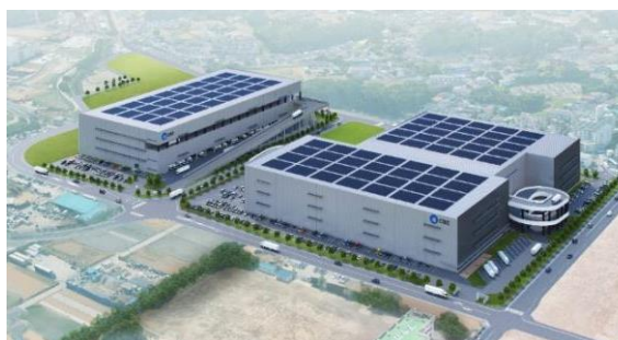
35 ロジスクエア朝霞 A 2026年竣工予定 36 ロジスクエア朝霞 B 2026年竣工予定