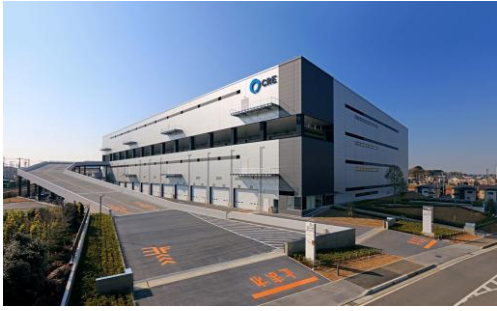
7 ロジスクエア浦和美園 2017年4月竣工