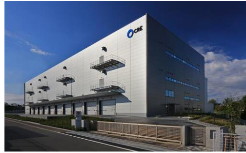
8 ロジスクエア新座 2017年4月竣工