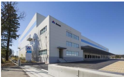
3 ロジスクエア日高 2015年3月竣工