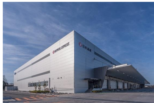
11 ロジスクエア鳥栖 2018年2月竣工