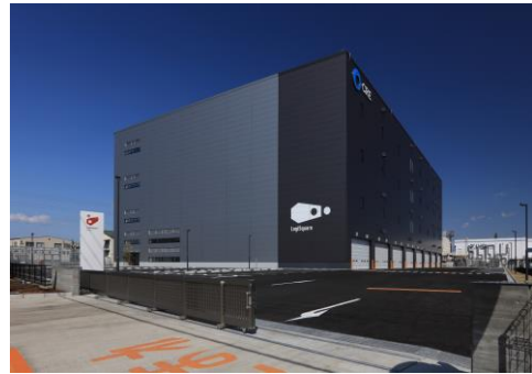
24 ロジスクエア厚木 I 2023年3月竣工