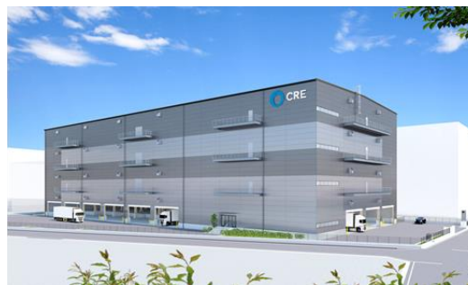
39 ロジスクエア草加Ⅱ 2024年9月竣工予定