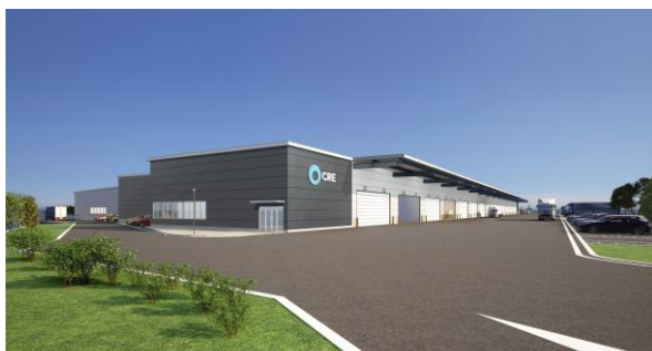
38 ロジスクエア成田 2024年5月竣工予定