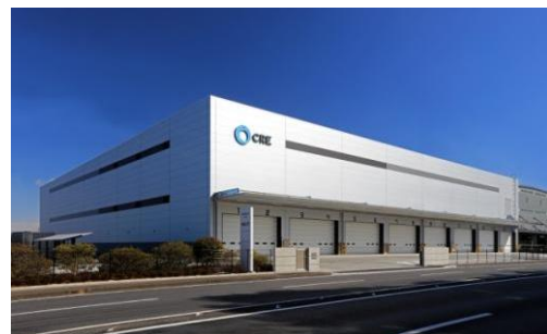
6 ロジスクエア久喜Ⅱ 2017年2月竣工