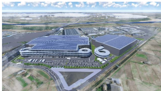
32 ロジスクエア京田辺 A 2025年2月竣工予定 33 ロジスクエア京田辺 B 2026年竣工予定