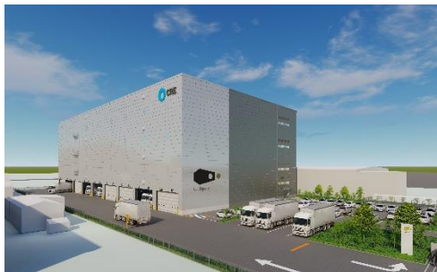
28 ロジスクエア厚木Ⅱ 2024年3月竣工予定