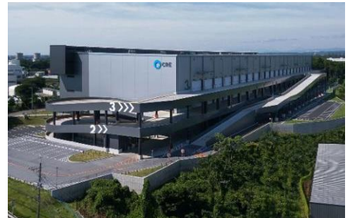
18 ロジスクエア狭山日高 2020年6月竣工