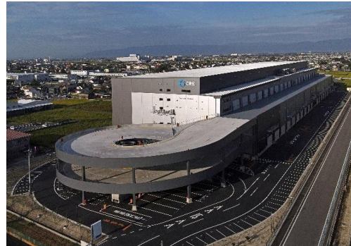
26 ロジスクエア一宮 2023年9月竣工