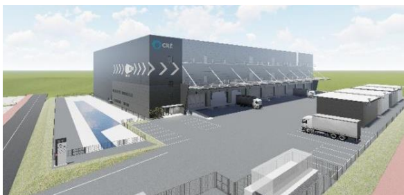
27 ロジスクエア福岡小郡 2024年2月竣工予定