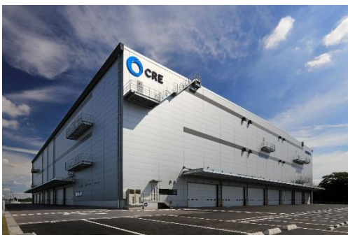
13 ロジスクエア春日部 2018年6月竣工