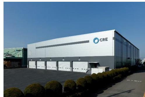
12 ロジスクエア川越 2018年2月竣工