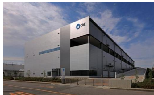
4 ロジスクエア久喜 2016年6月竣工