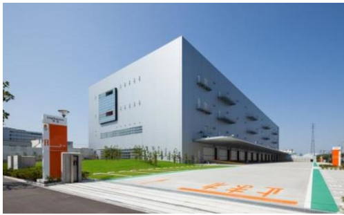
1 ロジスクエア草加 2013年6月竣工