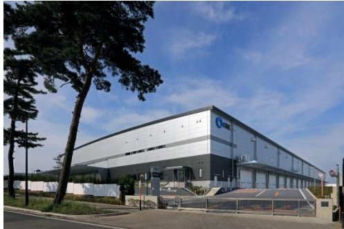
9 ロジスクエア守谷 2017年5月竣工