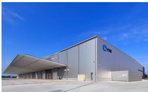
5 ロジスクエア羽生 2016年7月竣工