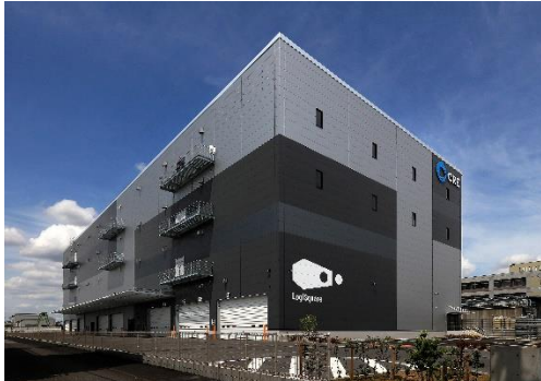
25 ロジスクエア松戸 2023年5月竣工