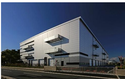
21 ロジスクエア伊丹 2022年11月竣工