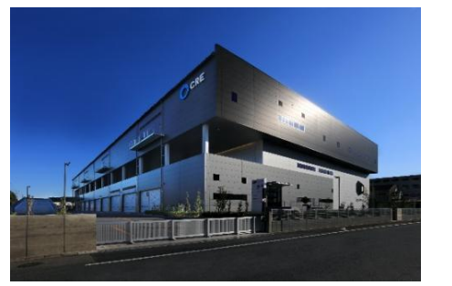
22 ロジスクエア白井 2022年12月竣工