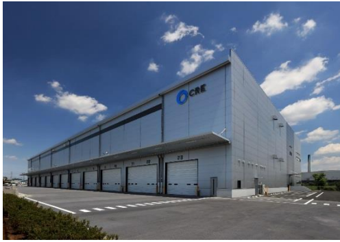
15 ロジスクエア川越Ⅱ 2019年6月竣工