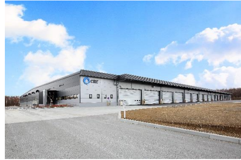
10 ロジスクエア千歳 2017年12月竣工