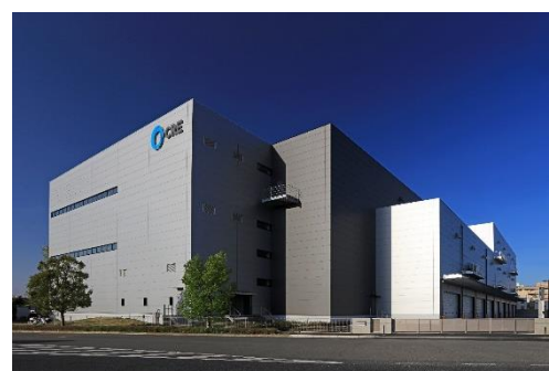
14 ロジスクエア上尾 2019年4月竣工