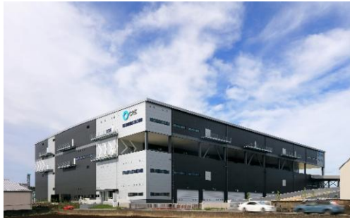
17 ロジスクエア三芳 2020年6月竣工