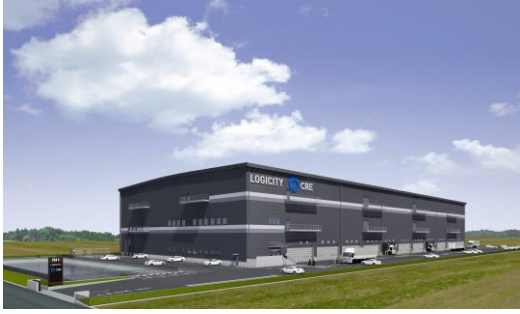
40 (仮称) ロジシティ小郡 2024年7月竣工予定 ※パースはイメージであり、今後変更となる可能性があります。