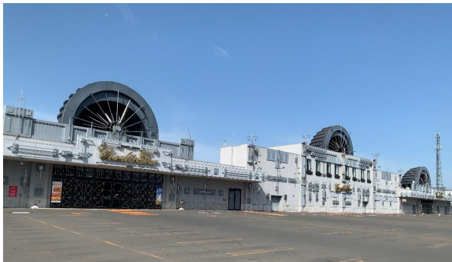
※『gashacoco コーチャンフォー北見店』外観