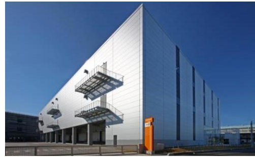
2 ロジスクエア八潮 2014年1月竣工