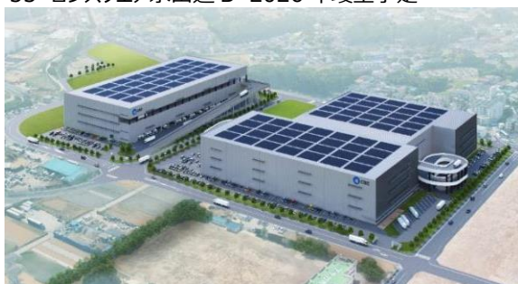
35 ロジスクエア朝霞 A 2026年竣工予定 36 ロジスクエア朝霞 B 2026年竣工予定