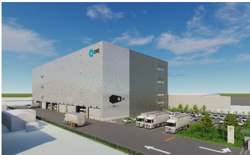
28 ロジスクエア厚木Ⅱ 2024年3月竣工予定