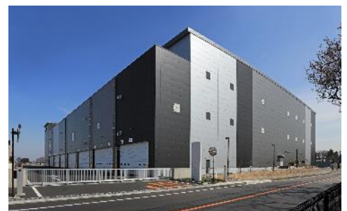
20 ロジスクエア三芳Ⅱ 2021年3月竣工