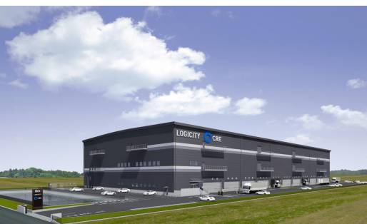
40 (仮称) ロジシティ小郡 2024年7月竣工予定