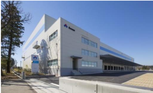
3 ロジスクエア日高 2015年3月竣工