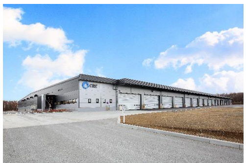
10 ロジスクエア千歳 2017年12月竣工