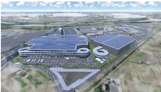
32 ロジスクエア京田辺 A 2025年2月竣工予定 33 ロジスクエア京田辺 B 2026年竣工予定