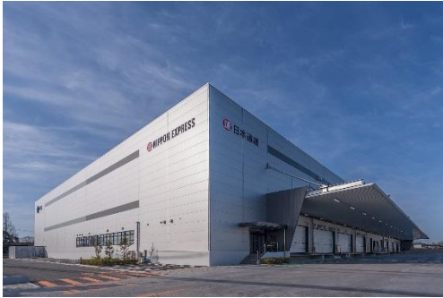
11 ロジスクエア鳥栖 2018年2月竣工