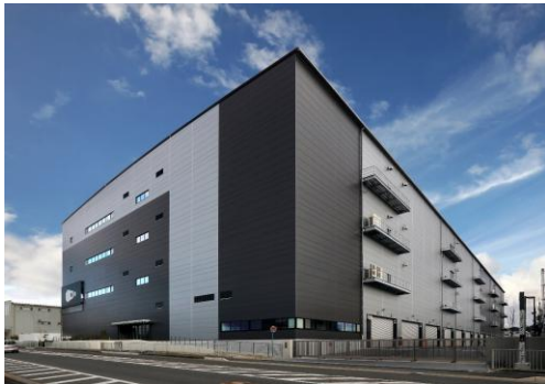
23 ロジスクエア枚方 2023年1月竣工