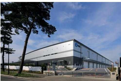
9 ロジスクエア守谷 2017年5月竣工