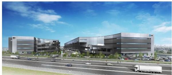
29 ロジスクエアふじみ野 A 2024年1月竣工予定 30 ロジスクエアふじみ野 B 2024年10月竣工予定