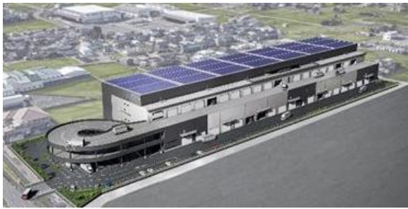
26 ロジスクエア宮 2023年9月竣工予定