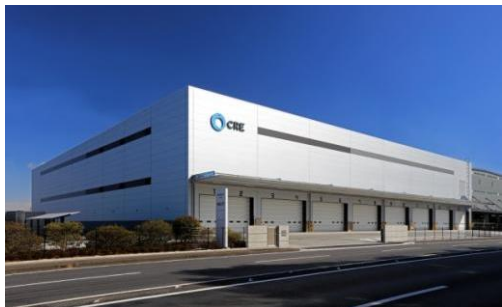
6 ロジスクエア久喜II 2017年2月竣工