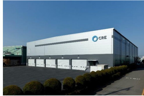
12 ロジスクエア川越 2018年2月竣工