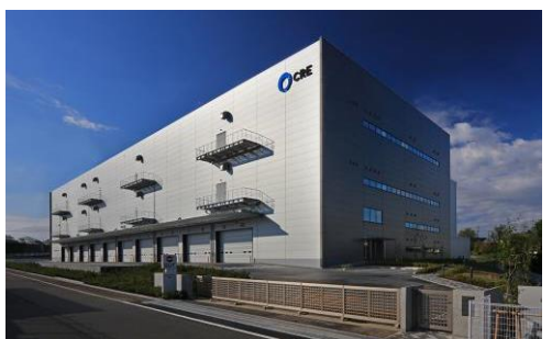
8 ロジスクエア新座 2017年4月竣工