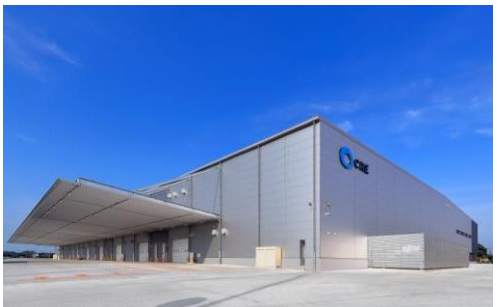
5 ロジスクエア羽生 2016年7月竣工