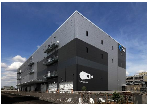
25 ロジスクエア松戸 2023年5月竣工