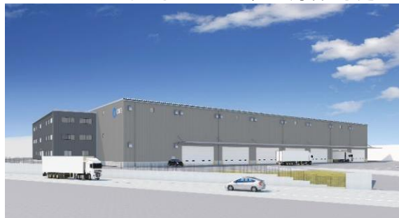
34 ロジスクエア掛川 2024年1月竣工予定