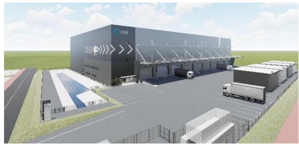
27 ロジスクエア福岡小郡 2024年2月竣工予定