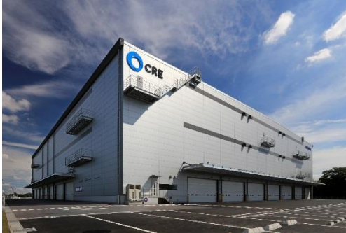
13 ロジスクエア春日部 2018年6月竣工