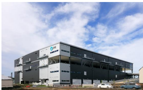
17 ロジスクエア三芳 2020年6月竣工