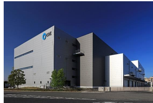
14 ロジスクエア上尾 2019年4月竣工