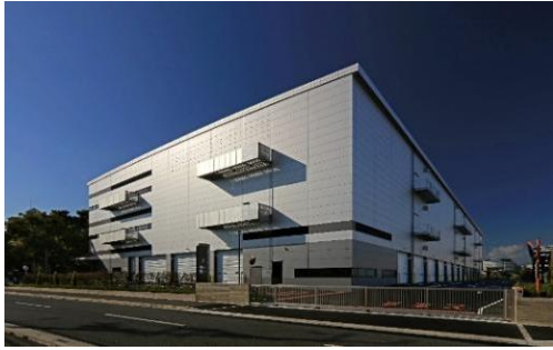
21 ロジスクエア伊丹 2022年11月竣工