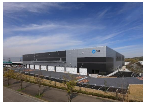
16 ロジスクエア神戸西 2020年4月竣工