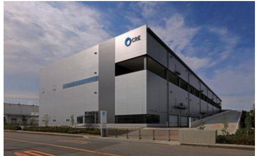
4 ロジスクエア久喜 2016年6月竣工