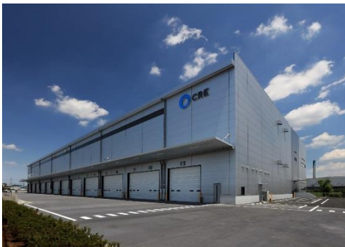
15 ロジスクエア川越Ⅱ 2019年6月竣工