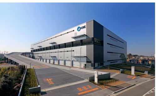
7 ロジスクエア浦和美園 2017年4月竣工