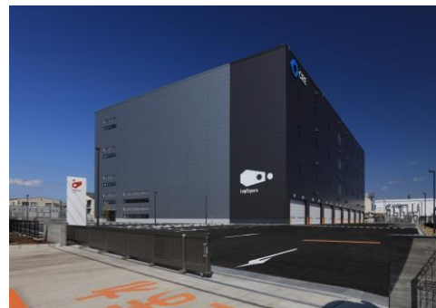
24 ロジスクエア厚木 I 2023年3月竣工