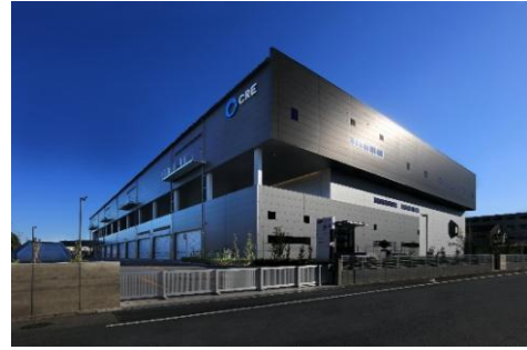
22 ロジスクエア白井 2022年12月竣工