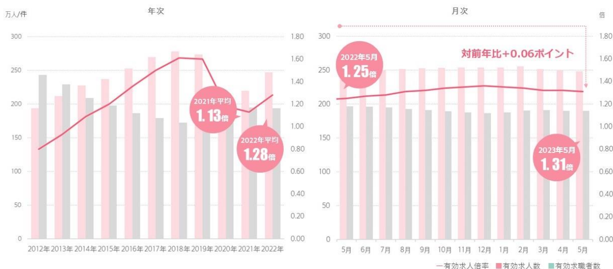
求人倍率① 求人・求職及び求人倍率の推移（全国/季節調整値）/5月

2023年5月度の有効求人倍率（季節調整値）は1.31倍。前月比-0.01ポイント、前年同月比+0.08ポイントとなりました。パートのみの求人倍率（季節調整値）は1.32倍、正社員の有効求人倍率（季節調整値）は1.03倍で、パートと正社員は前月と同水準という結果になりました。全体的にここ数か月横ばいが続いています。