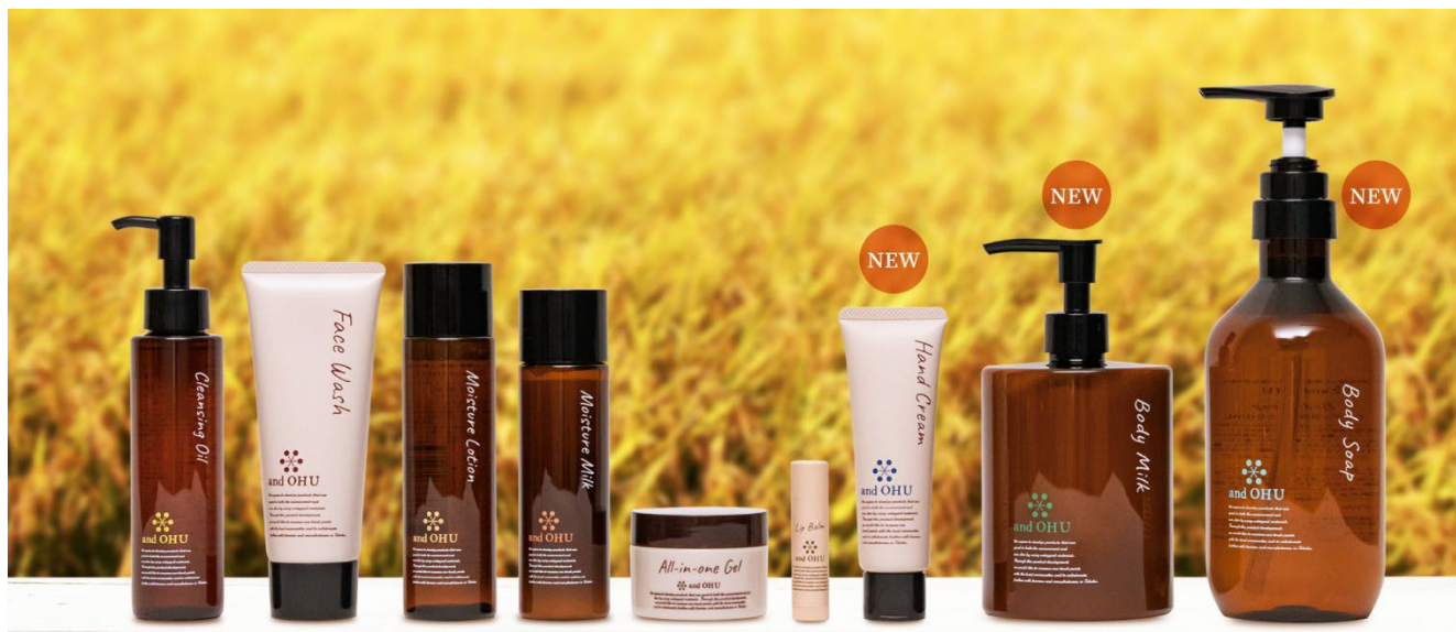
and OHUシリーズに新しく3アイテムが登場