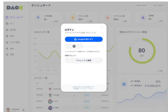
ウォレットを自動生成

※2: Non-Fungible Token の略称であり、唯一無二であると証明されたデジタルデータ