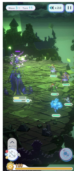
『ディズニー ピクセルRPG』 ゲーム画面

簡単操作&オート機能で誰でも手軽にバトルを体験できる他、アバターの着せ替えや、放置しておくことで自動的にアイテムを集めてくれる探索機能など、バトル以外にもお楽しみいただける要素が詰まっています。