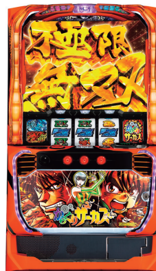
パチスロ からくりサーカス 原作/藤田和日郎「からくりサーカス」(小学館少年サンデーコミックス刊)/ Licensed by Sony Music Labels Inc.