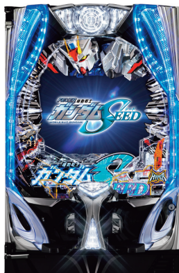
フィーバー機動戦士ガンダムSEED ©創通・サンライズ