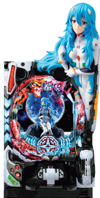
ばちんこ シン・エヴァンゲリオン Type レイ ©カラー