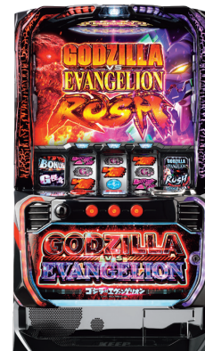
L ゴジラ対エヴァンゲリオン ©カラー TM & © TOHO CO., LTD.