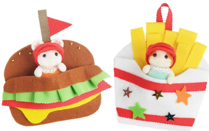
ハンバーガー&ポテトポケット（赤ちゃん人形用） ¥1,100（税込）