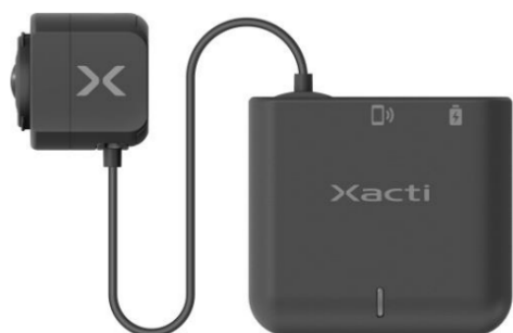
ウェアラブルライブ映像デバイス「CX-WL100」