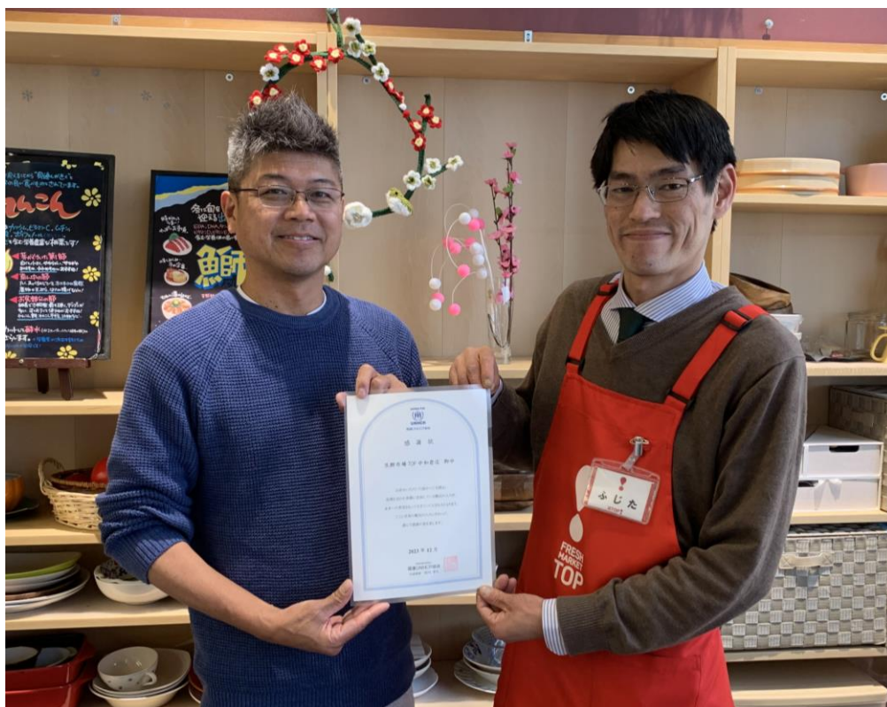
当社代表取締役社長岩崎（左）と 代表店舗としてTOP 中和倉店店長（右）