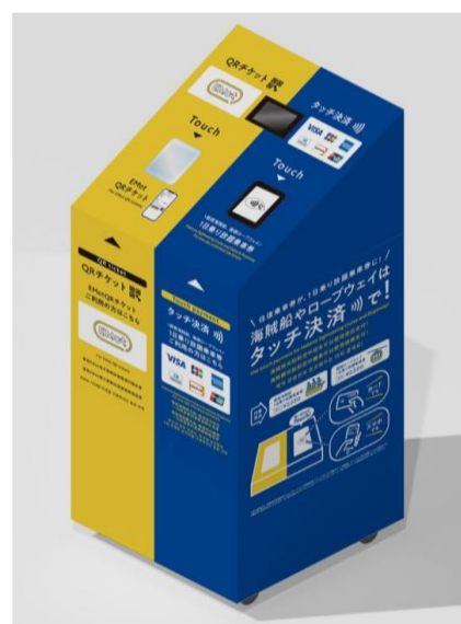
専用端末（イメージ）

小田急箱根グループでは、タッチ決済とQR チケットで周遊観光の環境整備を推進してまいります。なお、ロープウェイに国際ブランドのタッチ決済を導入するのは、全国初の取り組みです。