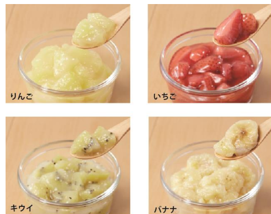
のせる生ジャムミックスの調理例